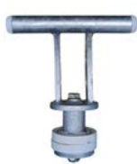
Aanmeerkikker uit gegalvaniseerd staal