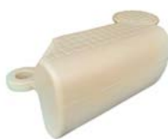
Fender met 2 oren