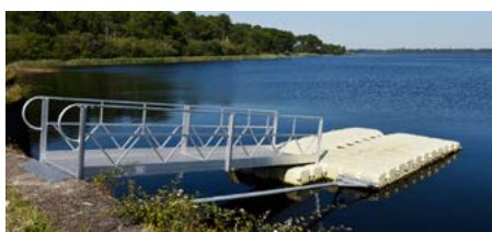
Bevestiging van de loopbrug aan de oever