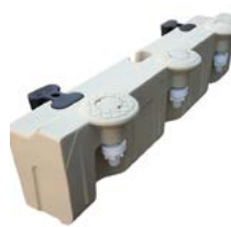
Adapter voor kubussecties