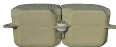
Verankering met kabels