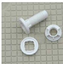
Schroef, moer en sluitring