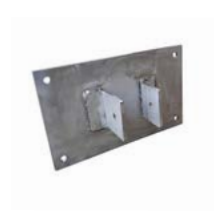
Kade met een plaat