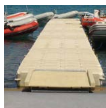
Systeem van wielen voor loopbrug