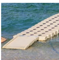
Bevestiging van de loopbrug aan de steiger