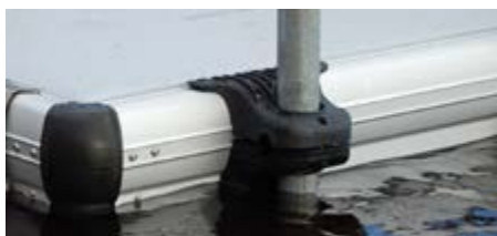
Support pour pieux