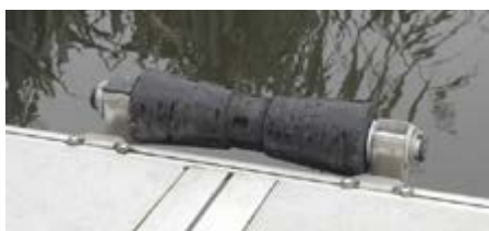
Rouleau de mise à l'eau