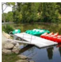
Passerelle en aluminium