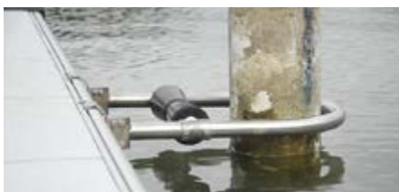
Étrier en inox