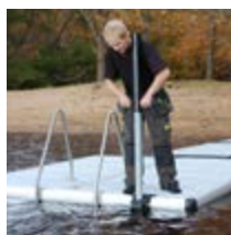
Masse pour pieux