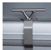
Taquet d'amarrage en inox