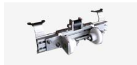
Étrier en aluminium pour poutrelle HEB