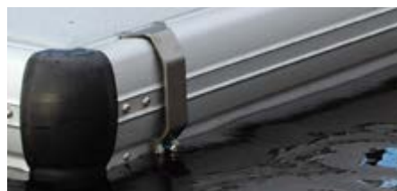
Anneau d'amarrage en inox