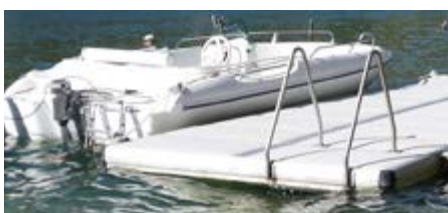
Echelle de bain

Le profilé en aluminium en C sur le pourtour de chaque section de ponton permet l'adaptation de toute une série d'accessoires, standards comme ceux que nous vous proposons ici (pare-battage, anneau d'amarrage, échelle de bain, etc.) ou sur mesure, réalisés par nos soins ou les vôtres.