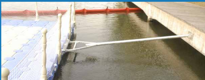
Verankerung durch Verankerungsbügel

Ein Badebecken kann mit Ketten an Betonblöcke oder mit Verankerungsbügel am Ufer befestigt werden. Alles hängt davon ab in welchem Umfeld Sie sich befinden, und von der Art Wasserfläche. Neben dem Umfangsnetzes das auf den Geländerpfeosten befestigt wird um die Struktur sicher zu tun, bieten wir auch Badeleitern aus Polyäthylen um die Einheit der Komponente zu halten. Schließlich sind eine oder zwei Zugangsbrücken aus Polyäthylen oder Aluminium öfters notwendig.