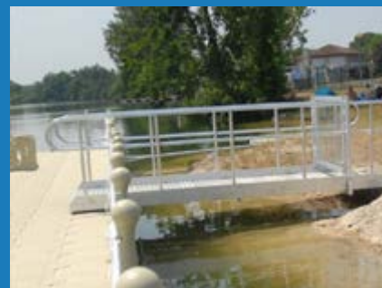
Passerelle en aluminium